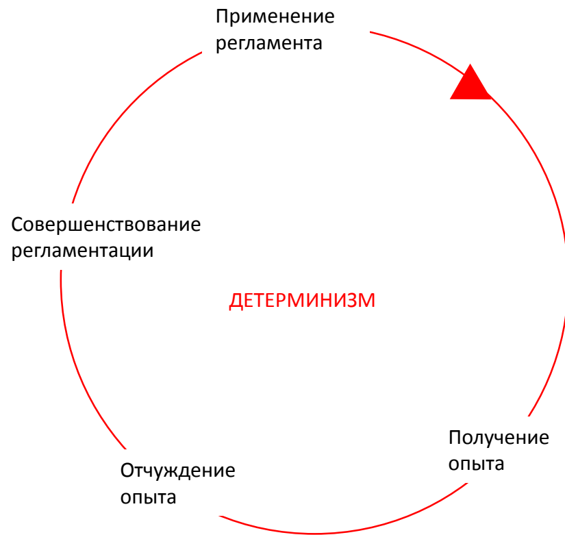
Цикл прямого накопления опыта в виде регламента